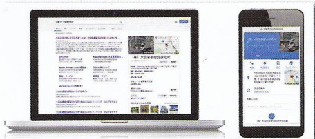
大阪彩都総合研究所を検索したケース。PC表示の右側部分と、スマホ表示の部分がナレッジパネル

こうしたスマートフォンの普及に伴い、Googleの検索結果表示で、それまで広告枠に使用されていた右側部分に、ナ